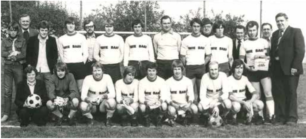
De eerste ploeg Union Abele kreeg in oktober voor het seizoen 1978-1979 nieuwe truien.