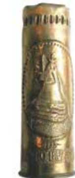
'Het mirakel van O.L.V van Sint-Jan Poperinge'