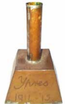
Kandelaar 'Ypres 1914-15'