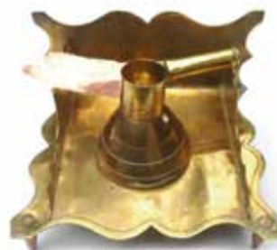
Inktstel 'Souvenir de guerre Merckem, 1918'