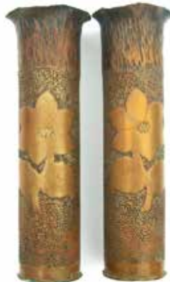
'Souvenir d'Ypres, 1919'