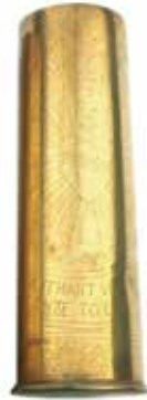
'Heilig hart van Jezus Beschermt ons Vaderland' Gaspar