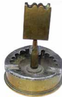
Asbak 'Flanders the great war Ypres 1914-19'