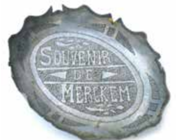
Asbak in aluminium van een veldfles 'Souvenir de Merckem'