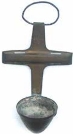
Wijwatervaatjes gemaakt van beschermstukken van de bom, voor de top en onderkant