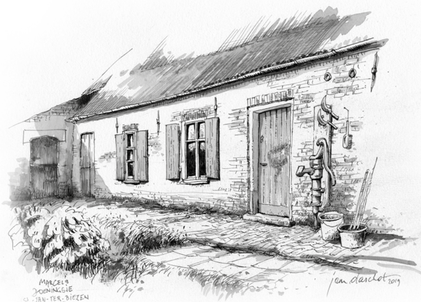
"Het Doeningske" toestand 2014

De klimaatverandering en een toenemend mobiliteitsprobleem dwingen de Vlaamse Overheid tot het herzien van de huidige ruimtelijke ordening. Als belangrijk instrument hiertoe wil ze de versnippering van het Vlaamse landschap indijken. Daartoe ontwikkelde de Vlaamse Bouwmeester een visie waarbij, naast de versterking van de steden, het open gebied geherwaardeerd moet worden. Naast het adviseren bij projecten met een grote invloed op de ruimtelijke