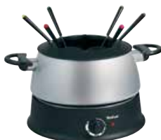
Tefal EF300010 Fondue

1300 W - vaatwasbestendig - regelbare thermostaat - 8 vorkjes - vorkhouder - controle lampje - anti-aanbaklaag - uitneembare fonduepot 2,5 l