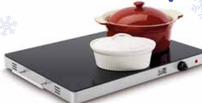
Fritel WT2478 warmhoudplaat XXL

54x41 cm - 400 W - traploos regelbare temperatuur: 20 tot 130 °C - gerechten warmhouden of opwarmen bordes