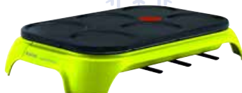
Tefal PY559312 crêpes party colormania

1000 W - 6 mini pannenkoeken - 6 spatels & 1 afmeeltelepel vaatwasbestendig - Thermo-Spot indicator - anti-aanbaklaag - aan/uit schakelaar