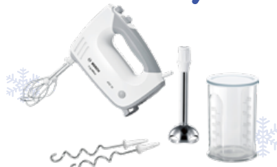
Bosch MFQ36470 handmixer

450 W - 5 snelheden - inox staaf - kloppers & kneedhaken - mengbeker met deksel