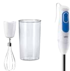
Braun MQ3005 Cream staafmixer

700 W - 2 snelheden - inox antispat staafmixervoet - POWERBell plus = verbeterde voet met extra mesje om harde ingrediënten snel te pureren - inclusief: inox klopper, beker 600 ml