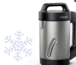
Philips HR2203/80 soup maker

1000 W - 5 functies - 1 snelheid + moment - receptenboek