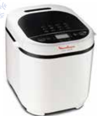
Moulinex OW210130 broodbakmachine

500 W - brood van 0,5 en 0,75 en 1 kg - 3 instellingen voor korst - 12 programma's - glutenvrij - baguette - warmhoudstand 1 u