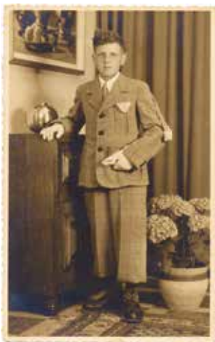
Pl. Communie in de Kapelle in 1947