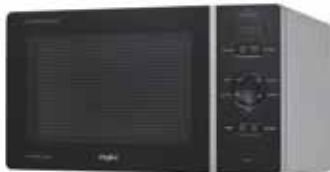
Whirlpool MCP 341 SL microgolfoven solo

Chef Plus - 25 l - 800 W - draaischotel: 28 cm - functies: Jet Start - Jet Defrost Menu - Jet reheat Menu - child lock - zilver