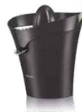
Philips HR2752/90 citruspersers

85 W - sap direct in glas - pulpselector