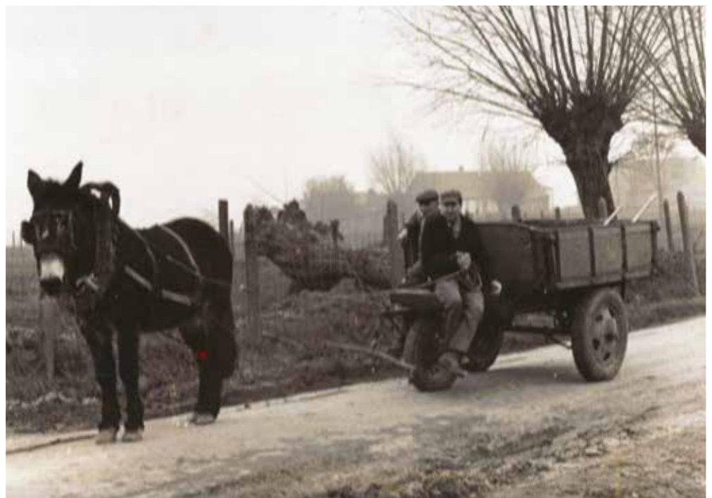
De 'vuilkar' van Sint-Jan-ter-Biezen: vanaf 1 januari 1950 haalden Michel en Marcel Cauwelier één maal per maand het huisvuil op. Vanaf 1960 werd dat twee maal per maand, de eerste en derde vrijdag. Michel kreeg van de gemeente Watou een maandelijks vergoeding van 225 fr.