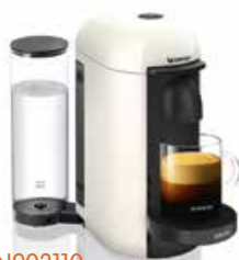
Krupps XN903110 Nespresso Vertuo

uitneembaar waterreservoir 1,2 l - automatische stop - 5 instellingen voor kopgrootte - 4 posities voor de tashouder - auto-off 9 min - centrifusie technologie - automatische dosering van de koffie - 40 s opwarmtijd - herinnering ontkalken - detectie leeg waterreservoir - wit