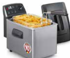
Fritel SF4350 friteuse

4 l - 2800 W - koude zone friteuse: verwarming op 2 niveaus = gepatenteerd TURBO SF® Systeem - Click System®, mantel in gelakt metaal - stofdeksel - COOL TOUCH handgrepen - volledig demonteerbaar