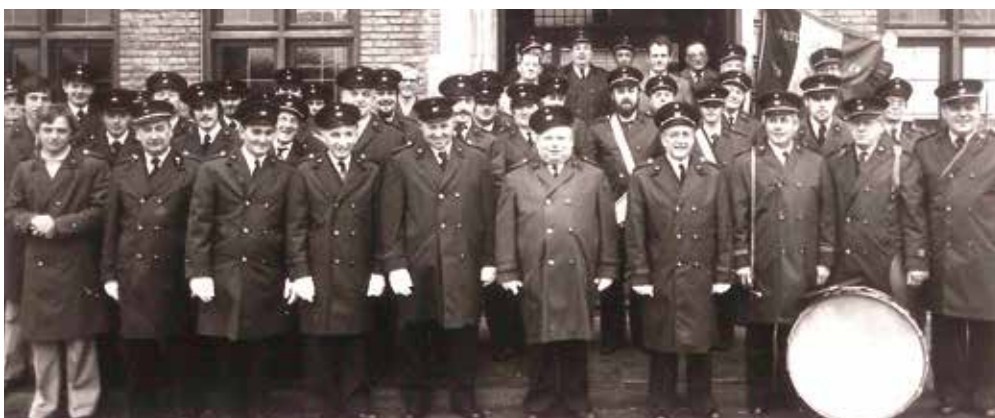
De decembermaand is traditioneel Barbaramaand en die heilige wordt door de brandweerlieden in de regio al sinds jaar en dag niet alleen in ere gehouden maar ook veelal uitgebreid gevierd. Traditioneel hoort daar ook meestal een groepsfoto bij. Wij vonden foto's van de posten van Proven, Roesbrugge en Watou.

December 1979 was in groot-Poperinge voor de postdiensten een feestmaand. In Poperinge-stad werd het postgebouw naast het stadhuis op de Grote Markt leeggemaakt. Het oude gebouw voldeed al lang niet meer aan de eisen van openbare dienstverlening. Het was moeilijk toegankelijk, de lokettenzaal was veel te klein en de postbedienden moesten zich bij momenten