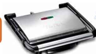
Tefal GC241D12 - panini grill

2000 W - aan/uit schakelaar - 745 cm 2 bakoppervlak - uitneembaar vetvangbakje - controlelampje - vertikaal opbergen - anti-aanbakplaten - rvs