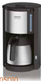
Krupps KM305D10 koffiezet met thermos

Pro Aroma - 1,25 l - 10-15 kopjes - 1100 W - uitneembare filterhouder - rvs thermo-isoleerkan - 4 u warmhouden - auto-off 30 min - zwart / rvs