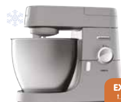
Kenwood KVL4120S keukenrobot

1200 W - 6,7 l mengkom in rvs - elektronische snelheidsregeling: variabele snelheden + pulse - Thermoresist glazen blender 1,6 l - accessoires: K-klopper, garde, deeghaak, spatdeksel met vulopening