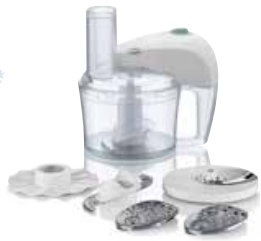
Philips HR7605/10 keukenrobot

350 W - kom 2,1 l - 1 snelheid + pulse - snijden, raspen, kneden en opkloppen