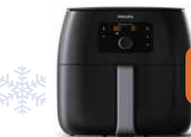
Philips HD9651/90 airfryer

1,4 kg - 2225 W - antikleef binnenpan - zonder olie of vet - Auto-off - digitale display - timer - oververhittingsbeveiliging - met receptenboekje